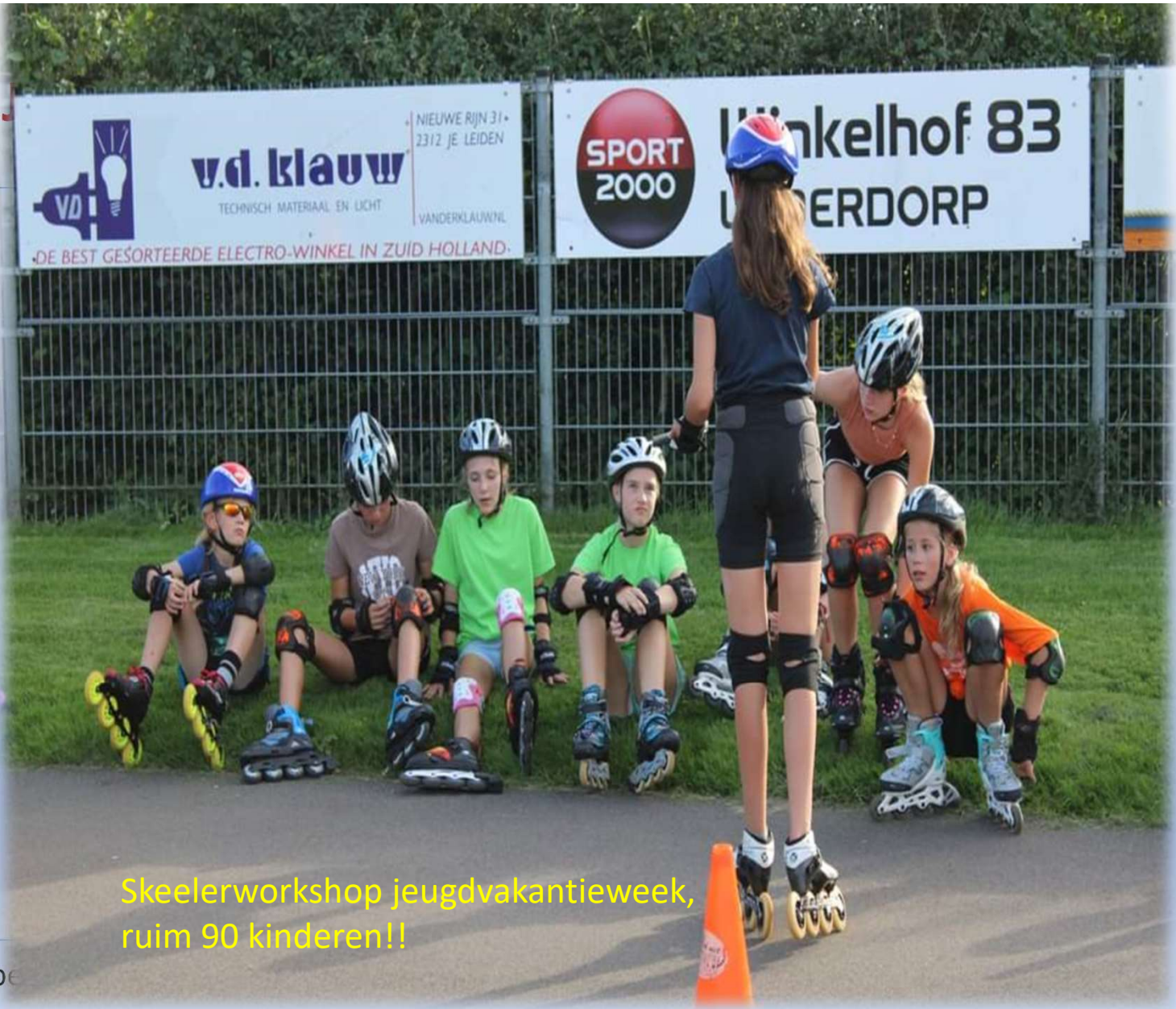
Skeelerworkshop jeugdvakantieweek, ruim 90 kinderen!!