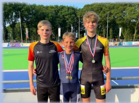
Nederlands Kampioenschap Inline