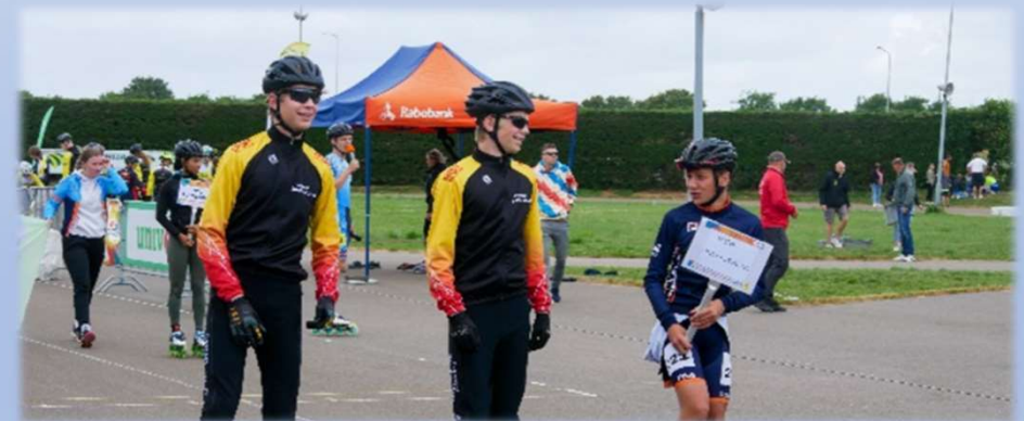
Radboud International Tournament